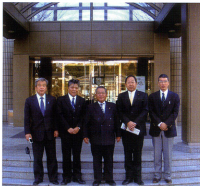
「日本一お年寄りにやさしい国」、「子育て支援日本一の町づくり」を目指している東京都日の出町を視察。

発行/成田市議会 会派 周政会 平成22年4月 議会事務局内/〒236-8585 成田市花崎町 760 電話/0476-20-1570 FAX/0476-24-0336