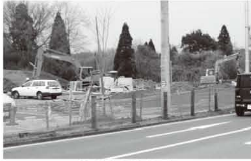
地元特産品直売用地

再度、さくらの山の質問をさせていただきます。現在駐車場の整備も急ピッチで進められ、本年4月に南三里塚からさくらの山までの、空港外周道路も完成され、益々、さくらの山への来場者が増えると思われまふ。騒音下で人の集まる所は此処以外にありません。年間約18万人とも言われる来場者があります。小泉市長は、どのようなお考えかお尋ねいたします。